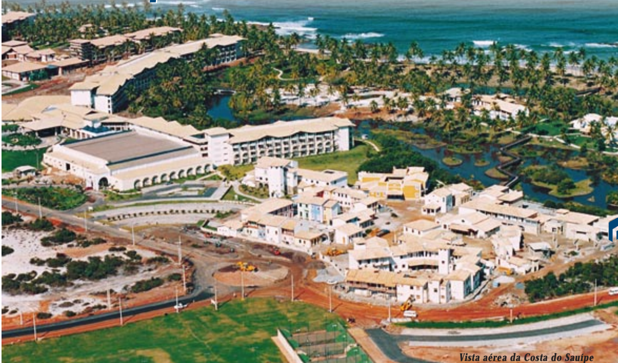
Vista aérea da Costa do Sauípe