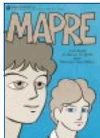
Cartilha do BB para os menores aprendizes

sembléia no sindicato. Sua missão era apresentar o "Azulão". Ele não se referia ao uniforme azul, mas ao movimento de menores aprendizes por mais oportunidades de ingresso no quadro do Banco. O movimento durou pouco. Dele ficaram a primeira e única edição do jornalzinho "Azulão, menores formando a união", de abril de 1983, e boas recordações.