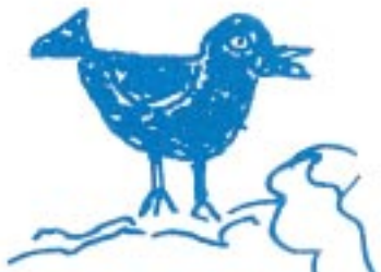
Ilustração do jornal "Azulão, menores formando a união" de 1983

Vestir o "azulão" e mudar de vida. Foi assim durante quase três décadas para milhares de garotos que trabalharam como Menor Aprendiz. Eram bons alunos de escolas públicas, de baixa renda, indicados pela direção do colégio para fazer prova e disputar uma vaga como Menor Aprendiz no Banco do Brasil. Para muitos, significava possibilidade de continuar os estudos e de ajudar a sustentar a casa. E mais: ascensão social e um futuro melhor.