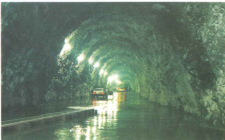
As águas passarão por um túnel de 1.350m antes de chegarem às turbinas